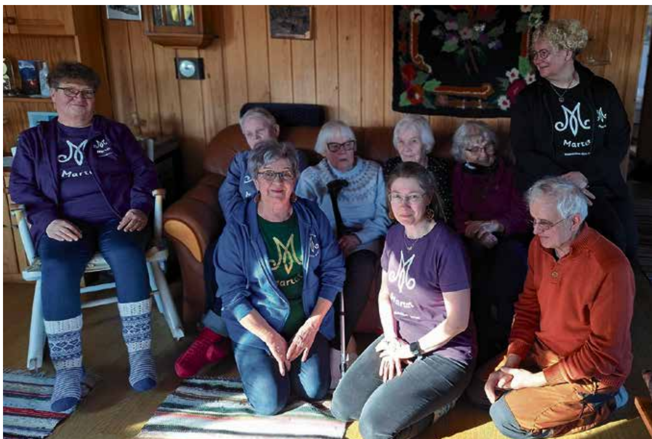
105-vuotista toimintaa juhlimassa helmikuussa.

tapahtuman, joka huipentui yhteiseen ruokailuun "kello illan suussa". Tämän vuoden teema on vielä auki, mutta jotain on tulossa sellainen pöhinä on päällä.